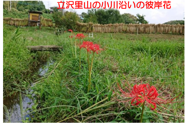
立沢里山の小川沿いの彼岸花

つちりと開花します。前述の同地の彼岸花と同じく、市内を散策すると各地で咲いています。立沢里