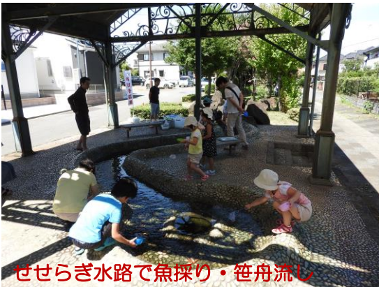
せせらぎ水路で魚採り・笹舟流し