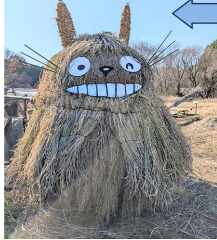
トトロの耳の完成

ご飯と豚汁が到着しました。木材をはり渡した腰掛けとテーブルで、子供たちは昼食です。里山のメンバーにも振る舞われ、おしいかったです。 子供たちは、収穫されたサツマイモをお父さんやお母さんと一緒に持ち帰りました。楽しかったかな。 「稲刈りの新しき藁でトトロ笑む」